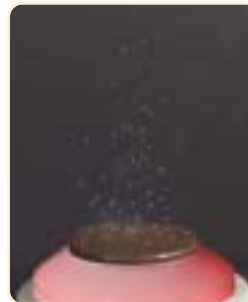
초음파진동현상 Cavitation of ultrasonic wave 超音波震動現象

也用于医疗用的钛元素, 对于生理抗拒现象的抵抗性和过敏反应微小。钛元素是金属中最亲和生物的元素。所以在酸性物质, 汗和海水中也腐蚀, 不变质, 具永久性, 被看好为白金的金代替品。